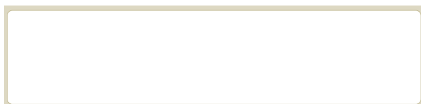
RFID-метка в виде этикетки, вид спереди