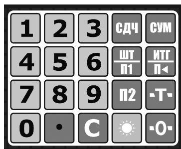
Рис. 3. Клавиатура